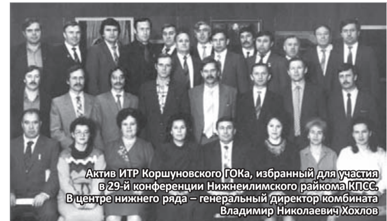
(Продолжение. Начало в №19, 20, 21, 22)

РЕЗУЛЬТАТЫ ПРОВЕРОК требований охраны труда и пром. безопасности на рабочих местах с 15 по 21 июня Рудногорский рудник: выявлено 15 нарушений. Коршуновский карьер: выявлено 7 нарушений. Управление железнодорожного транспорта: выявлено 9 нарушений. Обогатительная фабрика: выявлено 10 нарушений. Автотранспортное управление: выявлено 7 нарушений. РЭМЦ: выявлено 6 нарушений. СМУ: нарушений не выявлено. ЦСХ: нарушений не выявлено. Данные предоставлены отделом СОТ и ПК ПАО «Коршунровский ГОК»