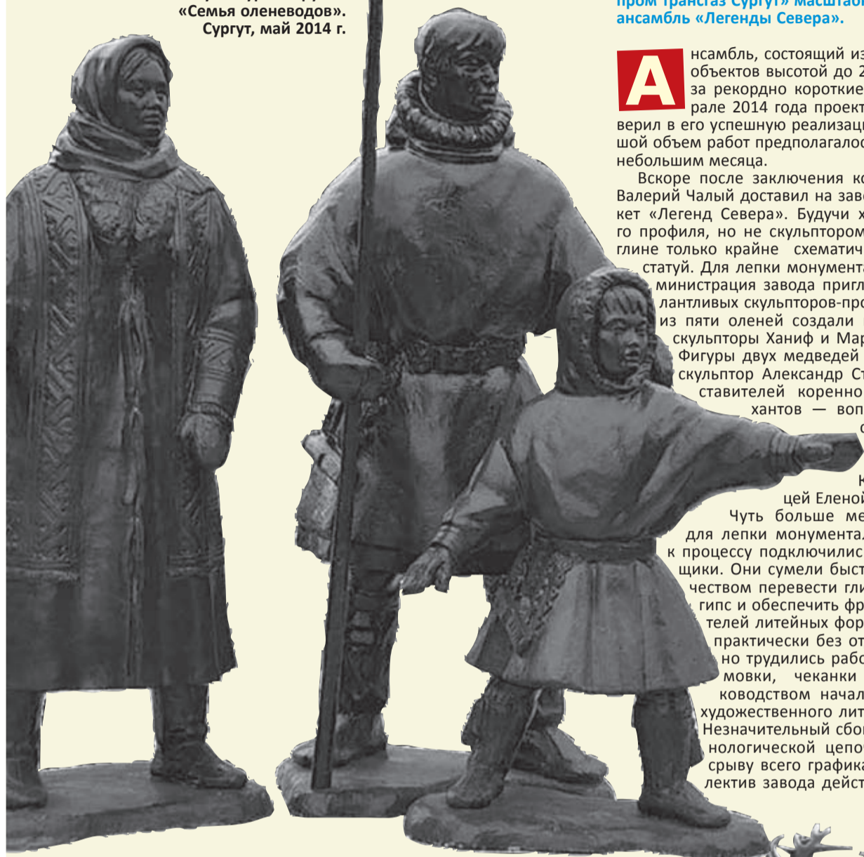
На переднем плане — скульптурная группа «Семья оленеводов». Сургут, май 2014 г.

Славная история Каслинского завода архитектурно-художественного литья пополнилась очередной яркой страницей: 11 июня 2014 года в Сургуте был открыт созданный каслинцами по заказу ООО «Газпром трансгаз Сургут» масштабный скульптурный ансамбль «Легенды Севера».