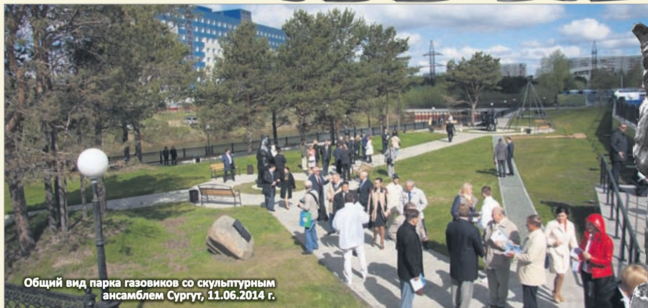
Общий вид парка газовиков со скульптурным ансамблем Сургут, 11.06.2014 г.