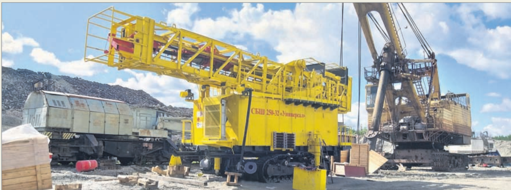
На Коршунковском карьере скоро пойдёт в работу новая буровая установка СБШ-250-32 «Универсал»

Руководят монтажом бурстанка специалисты сер-